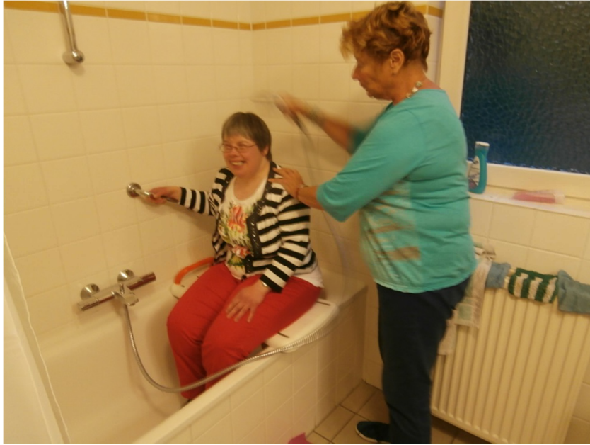
Op de badplank –dat is ontzettend handig en een aanrader om mee te nemen-